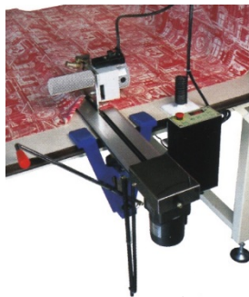
TEC-610S 自動走行手動昇降