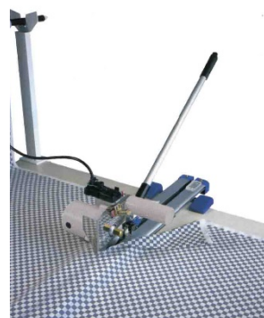
TEC-510L 自動走行手動昇降